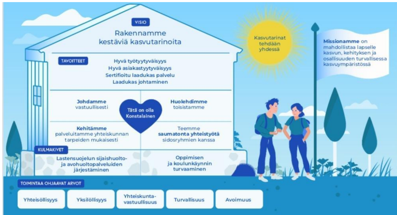
Kuva: Konstan strategikuva

Konstan Koti ja Koulu Oy tuottaa lastensuojelun sijaishuollon ostopalveluja hyvinvointialueille: